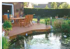
デッキウォーターガーデン