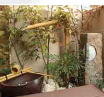
坪庭ウォーターガーデン

ラティスやフェンスを立てたり、樹木を植えて、池に直射日光が一日中当たりすぎないようにしましょう