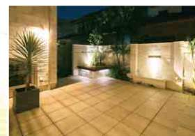
タイルモダンウォーターガーデン