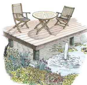
洋風の庭、和の庭、ライフスタイルに合わせた水辺をお楽しみください